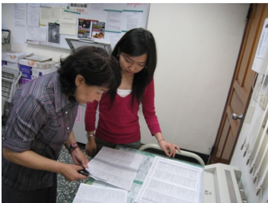
協助雍宜欽老師製作教材