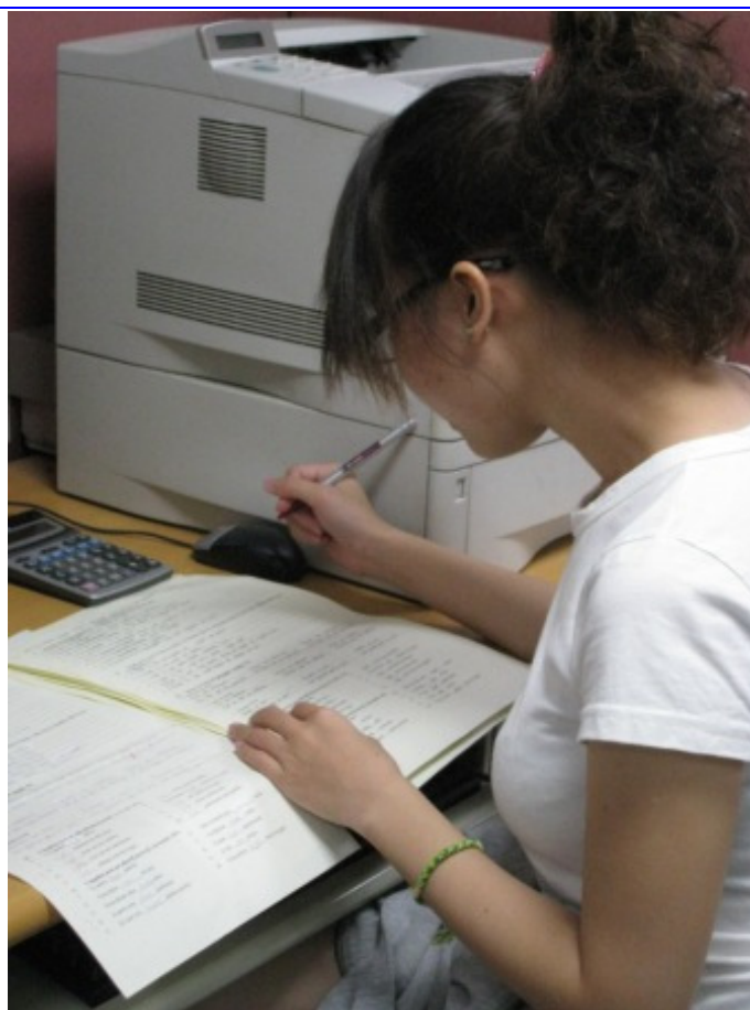
幫老師改小考考卷