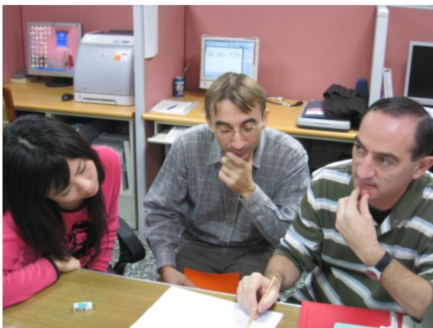
協助徐落茲、傅可得老師製作教材