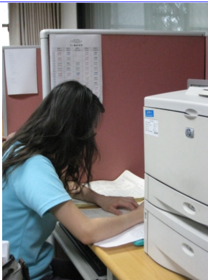
幫老師改小考考卷