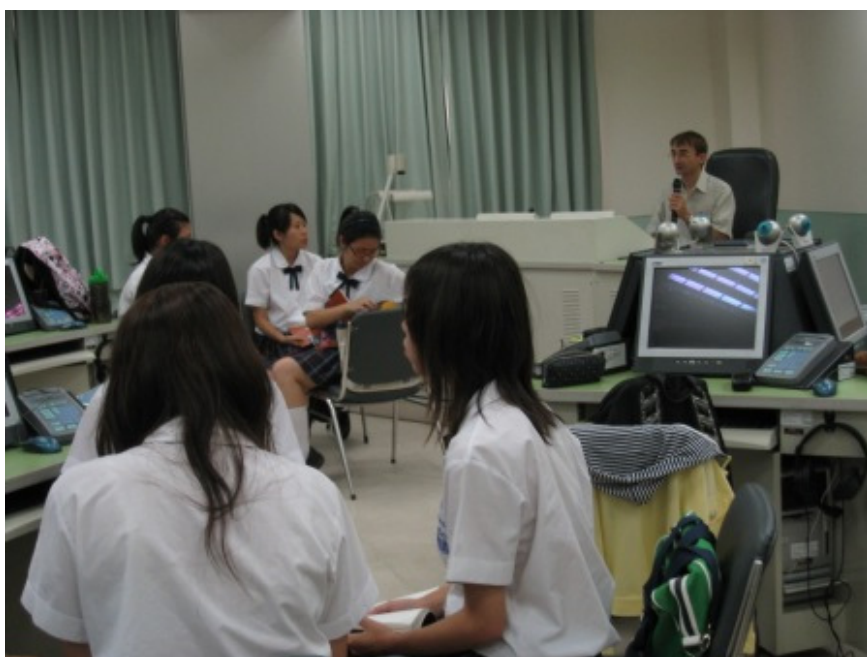
徐落茲老師上課情形