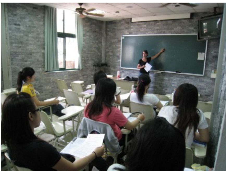
克萊森老師上課情形