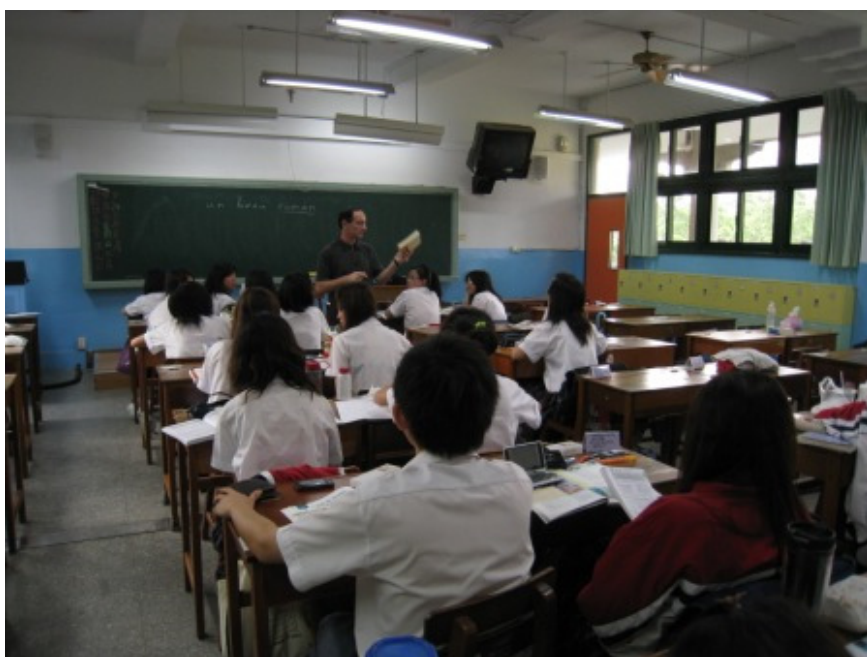
傅可得老師上課情形