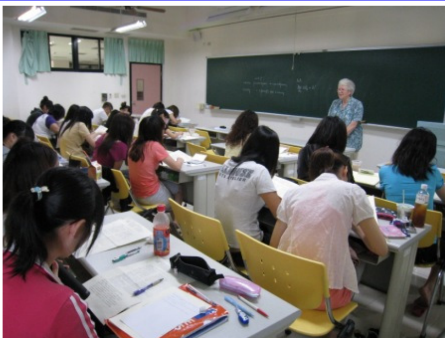
戴莉安老師上課情形