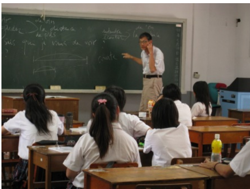
郎樸老師上課情形