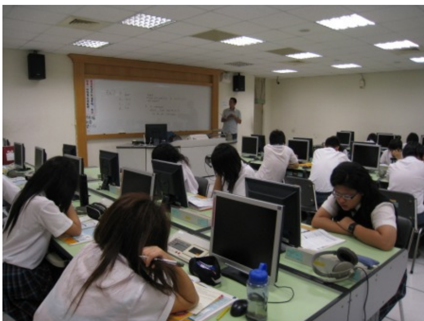
嚴松德老師上課情形